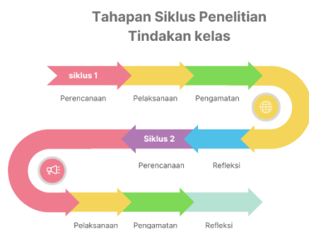
Gambar 1. Tahap siklus penelitian tindakan kelas

Penelitian tindakan kelas bertujuan untuk memperbaiki praktik pembelajaran di kelas. Penelitian ini merupakan sebuah bentuk penelitian yang dilakukan pada saat proses pembelajaran berlangsung dengan melakukan tindakan yang benar dengan subjek peserta didik. Penelitian ini memperbaiki dan meningkatkan kualitas proses pembelajaran yang dilakukan agar tercapainya tujuan pembelajaran dengan memuat perencanaan, pelaksanaan dan observasi, sebagai berikut. (Nanda et. Al, 2021).