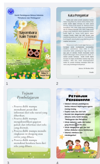
Gambar 2. Contoh Media Komik Digital Media yang dirancang dan telah menjadi sebuah produk yang utuh ini kemudian diuji validasi oleh para ahli media, ahli bahasa, dan ahli materi dengan hasil penilaian sebagai berikut :

Tahap ketiga yaitu tahap Development , pada tahap ini rancangan media yang telah dibuat akan dikembangkan menjadi sebuah produk yang utuh dari menggabungkan cover, isi cerita komik, dan soal yang ada digabungkan menjadi file berbentuk format .pdf kemudian dikonversikan menjadi komik digital berbentuk flipbook dan memasukkan audio suara menggunakan aplikasi HeyZine .