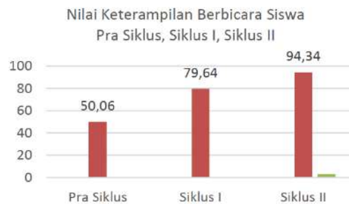
Gambar 9. Diagram Nilai Keterampilan Berbicara Siswa Pra Siklus, Siklus I, Siklus II

memperbarui RPP tipe HOTS dan hasil yang diperoleh dari siklus II yaitu 94,34 (sangat baik). Nilai keterlaksanaan belajar sebelum menggunakan model Time Token yaitu 2,75. Pada tahap penelitian siklus I nilai keterlaksanaan belajar yaitu 3,75. Selanjutnya untuk siklus II memperoleh nilai mendekati sempurna yaitu 4,75. Berikut gambar diagram nilai keterampilan berbicara pra siklus, siklus I, dan siklus II sebagai berikut.