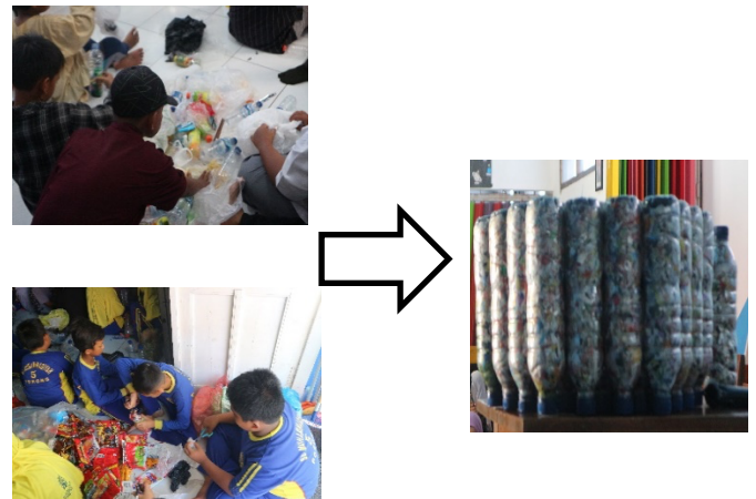
Gambar 1. Kegiatan siswa dalam pembuatan Eco Brick

cara mengelola sampah plastik, menemukan solusi yang ramah lingkungan, dan bekerja sama untuk mencapai tujuan yang sama. Siswa juga memahami bahwa dengan bekerja sama, mereka dapat membuat dampak yang lebih besar dalam menjaga lingkungan dan mengurangi limbah plastik secara keseluruhan.