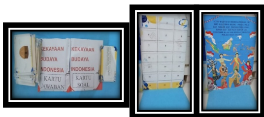
Gambar 3. Desain permainan puzzle kebudayaan

4) Buku panduan penggunaan media smart box berbasis make a match ini dicetak dengan kertas art carton untuk sampul depan dan belakang dengan laminasi doff, sedangkan kertas art paper untuk isi buku. Format buku panduan ini berukuran A5 (14,8 cm x 21 cm). Buku panduan ini terdiri dari sampul depan, kata pengantar, daftar isi, capaian pembelajaran, tujuan pembelajaran, materi tentang kekayaan budaya indonesia, mengenal media smart box berbasis make a match , biografi penulis, dan sampul belakang. Berikut ini desain buku petunjuk penggunaan media smart box berbasis make a match :