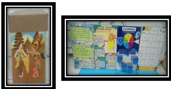
Gambar 1. Desain papan media smart box berbasis make a match

2) Permainan spinner kebudayaan indonesia yang terdapat pada sisi ketiga dilengkapi dengan gambar – gambar kebudayaan indonesia mulai