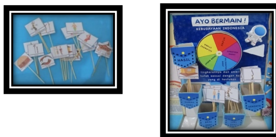
Gambar 2. Desain permainan spinner kebudayaan

3) Permainan puzzle kebudayaan berisi kartu soal dan jawaban berbentuk persegi panjang membahas soal pengetahuan tentang kebudayaan indonesia. Kartu jawaban terdapat dua sisi, sisi depan berisi potongan gambar kebudayaan indonesia sedangkan sisi belakang berisi jawaban dari kartu soal kebudayaan indonesia, di cetak