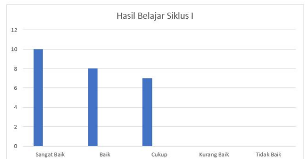
Gambar 3. Rekap Hasil Belajar Siklus I

siswa. Dibutuhkan siklus kedua untuk lanjutan dari siklus pertama, dengan harapan terjadi peningkatan hasil belajar siswa. Hasilnya direkapitulasi seperti :