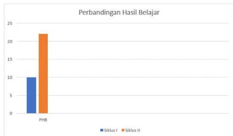
Gambar 5. Perbandingan Hasil Belajar pada Siklus I, dan Siklus II

Perbandingan hasil belajar siswa dalam bentuk grafik digambarkan seperti dibawah ini :