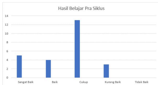
Gambar 2. Rekap Hasil Pembelajaran Pra Siklus

Uraian pada gambar 1 terdapat 20% siswa kategori kemampuan membaca kosakata Bahasa Arab sangat baik, 16% orang kategori baik, 52% siswa kategori cukup, 12% siswa dalam kategori kurang, serta 0% siswa pada kategori sangat kurang. Hasil ini menunjukkan bahwa 64% Kemampuan membaca siswa memerlukan peningkatan khusus terutama pada kosakata Bahasa Arab agar hasilnya menjadi sangat baik. Hal tersebut, yang mendasari peneliti lebih yakin dalam penerapan media gambar pada penguasaan kosakata Bahasa Arab.