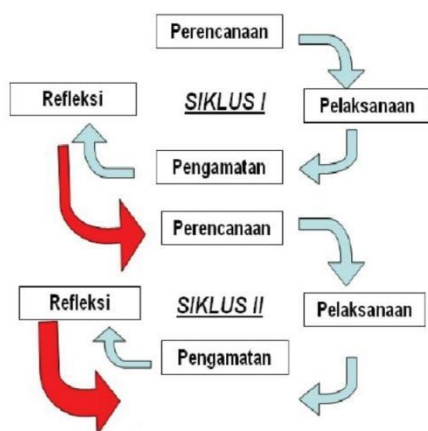
Gambar 1. Alur Penelitian Tindakan Kelas