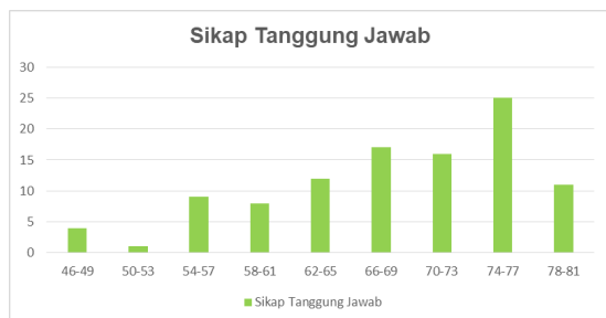
Gambar 2 Grafik Histogram Variabel Sikap Tanggung Jawab

Berdasarkan grafik histogram di atas, sebaran data menunjukkan bahwa 34 peserta didik berada di bawah angka rata-rata; 17 peserta didik berada pada angka rata-rata; dan 52 peserta didik berada di atas angka rata-rata.