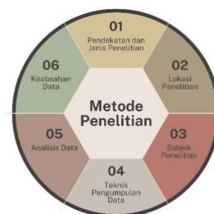
Gambar 1 Alur Penelitian