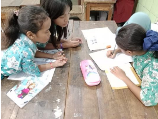
Gambar 3 Komunikasi dan Interaksi antar Budaya

terhadap budaya-budaya lain. Dengan demikian, diharapkan generasi muda dapat tumbuh menjadi individu yang menghargai dan menghormati keragaman budaya di masyarakat.