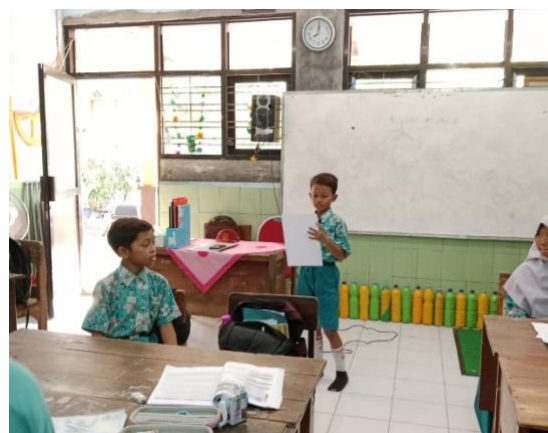
Gambar 2 Mengetahui dan Menghargai Budaya

haruslah menyajikan informasi yang akurat dan menarik bagi siswa. Selain itu, program tersebut juga harus memberikan kesempatan kepada siswa untuk berinteraksi langsung dengan budaya tersebut, misalnya melalui kegiatan menggambar, membuat kerajinan tangan, atau mendengarkan musik tradisional. Dengan demikian, SDN Tenggulunan dapat dijadikan contoh dalam mengembangkan program pendidikan yang mengenalkan budaya dari berbagai negara kepada siswa. Dengan begitu, diharapkan generasi muda dapat tumbuh menjadi individu yang lebih menghargai dan memahami keragaman budaya di dunia.