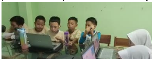
Gambar 1. Merakit robot menggunakan aplikasi.

Setelah mengikuti kegiatan ekstrakurikuler dilakukanlah evaluasi, teknik evaluasi digunakan untuk mengetahui sejauh mana kemampuan peserta didik. Menurut (Munastiwi 2019) evaluasi, yaitu proses pengukuran dan hasil yang dicapai sesuai dengan standar yang telah ditetapkan sebagai indikator penilaian sesuai dengan perencanaan yang telah dibuat. Dalam kegiatan ekstrakurikuler robotik waktu pelaksanaan evaluasinya dilaksanakan persemester (sumatif). Selain evaluasi yang dilaksanakan persemester, pembina serta tim juga