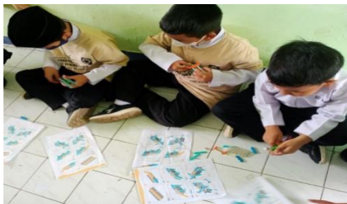
Gambar 2. Merakit lego

mereka lakukan seperti merakit lego dan merakit robot menggunakan aplikasi.