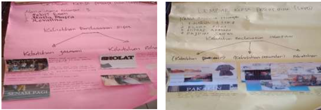
Gambar 2: Hasil kerja yang diselesaikan dengan melibatkan semua anggota kelompok.

Beberapa temuan dan masukan dari para observer dari guru mitra dan dosen menjadi redesign untuk pertemuan selanjutnya. Perbaikan pada aspek perencanaan yakni, lembar kerja yang dirancang dibuat dalam narasi kasus tentang inti masalah ekonomi yang sifatnya kontekstual, tidak berdasarkan buku siswa semata. Pada aspek pengelolaan kelas, guru model harus sering berlatih untuk mengurangi instruksi dalam pembelajaran. Baiknya untuk membantu menertibkan kelas sebelum pembelajaran dimulai, dibuat kesepakatan aturan/tata tertib dengan peserta didik sehingga aturan itu bersumber dari kesadaran peserta didik. Untuk beberapa peserta didik yang terlihat belum secara maksimal terlibat dalam proses pembelajaran, baiknya dikelompokkan bersama peserta didik lain yang dapat memberinya bantuan dalam proses belajarnya (tutor sebaya).