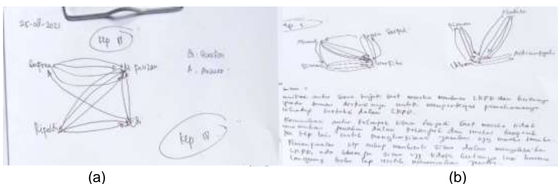
Gambar 3: (a) Pola dialog kelompok III dalam diskusi (b) pola dialog kelompok 1 dan IV yang tercatat dalam spider web discussion .

Pada saat diskusi, ditemukan pola dialog antar peserta didik dalam diskusi. Interaksi dalam dialog peserta didik yang membahas terkait materi yang sedang dibahas berupa dialog bertanya, menjawab, dan menguatkan temuan informasi dari berbagai sumber informasi. Catatan pola dialog diskusi tersebut dapat dilihat pada gambar berikut;