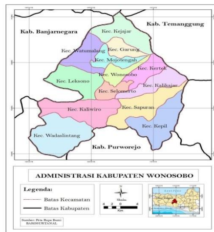
Gambar 1 Peta Kabupaten Wonosobo 2018

Kecamatan Kertek merupakan kecamatan yang berada di Kabupaten Wonosobo yang terletak di Provinsi Jawa Tengah. Kecamatan Kertek juga merupakan salah satu kawasan di Kabupaten Wonosobo yang memiliki daerah pegunungan. Terletak di sebelah timur ibukota Kabupaten Wonosobo, dengan jarak 9 km dari jalan jalur Kabuapten Temanggung, yang memiliki luas daerah 62,14 Km 2 atau 6,31% dari luas Kabupaten Wonosobo. Secara geografis, Kecamatan Kertek terletak pada 7 o 18'40"- 7 o 24'40" lintang selatan (LS) dan 109 o 93'30"- 110 o 02'35" bujur timur (BT). Kecamatan Kertek berbatasan langsung dengan Kabupaten Temanggung di sebelah utara, di sebelah timur dengan Kecamatan Kalikajar, di sebelah selatan dengan Kecamatan Selomerto, dan di sebelah barat berbatasan dengan Kecamatan Wonosobo. Secara administratif, Kecamatan Kertek terdiri dari 19 desa dan 2 kelurahan yang terdiri dari Desa Sindupaten, Surengede, Bojasari, Kertek, Sumberdalem, Purwojati, Karangluhur, Ngadikusuman, Wringinanom, Sudungdewo, Bejiarum, Damarkasih, Banjar, Tlogodalem, Pagerejo, Candimulyo, Purbosono, Candiyasan, Kapencar, dan Reco. Dengan desa terluas adalah Desa Candiyasan dan yang terkecil adalah Desa Banjar. Untuk lebih jelasnya dapat dilihat pada tabel berikut: