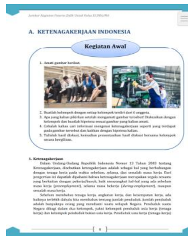
Gambar 4. Lembar Tugas dan Materi Sebelum Revisi

Tahap yang terakhir yaitu tahap pengembangan ( develop ). Tahap ini melalui tiga langkah yaitu telaah dan revisi, validasi, dan uji coba. Setelah prototype satu LKPD selesai, LKPD akan ditelaah oleh para ahli untuk diberi masukan dan saran dalam penyempurnaan LKPD sebelum diuji cobakan kepada peserta didik.