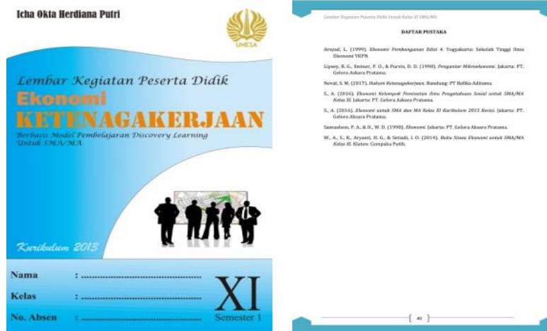
Gambar 3. Cover dan Daftar Pustaka LKPD

tersebut dijadikan untuk memudahkan peserta didik mendapatkan konsep secara mandiri melalui hasil pengamatannya serta pencarian informasi dari beberapa sumber. selain itu agar mempermudah peserta didik mencerna materi maka disajikan ilustrasi gambar yang disesuaikan materi. Langkah terakhir yaitu menentukan format, dalam menentukan format dibagi menjadi empat langkah yaitu: 1) menentukan jenis LKPD, LKPD dirancang dalam mencapai KD 3.3 mengenai permasalahan ketenagakerjaan dalam pembangunan ekonomi dengan menggunakan discovery learning sebagai model pembelajarannya. Penggunaan model discovery learning untuk menjadikan peserta didik sebagai pusat belajar yang aktif; 2) menentukan judul LKPD, judul LKPD dirancang berdasarkan model pembelajaran yang dijadikan pada pengembangan LKPD yaitu model discovery learning . Maka judul yang digunakan adalah “ Lembar Kegiatan Peserta Didik Berbasis Model Pembelajaran Discovery Learning”; 3) penyusunan materi, materi yang disajikan pada pengembangan LKPD yaitu materi ketenagakerjaan; 4) rancangan awal, pada rancangan awal desain LKPD disusun oleh peneliti dengan menghasilkan prototype 1.