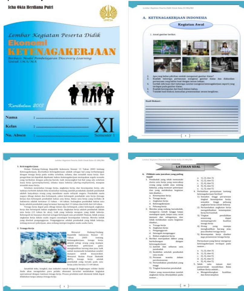
Gambar 5. LKPD Setelah Revisi

Setelah ditelaah oleh beberapa ahli, LKPD direvisi berdasarkan hasil telaah dari validator. LKPD yang dikembangkan terdiri dari sampul, kata pengantar, daftar isi, petunjuk penggunaan LKPD, KI dan KD, materi, lembar tugas, latihan soal, dan daftar pustaka. Pada LKPD yang dikembangkan terdapat banyak gambar yang berwarna guna menarik minat peserta didik dan meningkatkan pemahamannya terhadap materi. Selain itu kegiatan atau tugas ditampilkan di awal LKPD sebelum masuk pada materi untuk mendorong peserta didik turut aktif dalam pembelajaran.