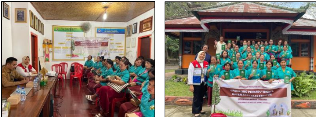
Gambar 6. Kegiatan Up Skilling Pemandu Wisata Alas Kedaton Monkey Forest

Secara konseptual, keberhasilan mempertahankan standar kenyamanan dan ketertiban kawasan dalam skala harian ini mengindikasikan bahwa mekanisme kerja sama antar-institusi telah berfungsi dengan baik sebagai instrumen penguat efikasi kolektif. Selain perbaikan fasilitas fisik, hasil antara ( intermediate outcomes ) yang tidak kalah krusial dalam aspek non fisik adalah terlaksananya kegiatan Up Skilling bagi Pemandu Wisata Alas Kedaton yang ditunjukkan pada Gambar 6 berikut ini: