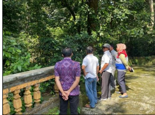
Gambar 2. Survey Lokasi dari PT. Pertamina Fuel Sanggaran

Selain keterlibatan pemerintah daerah, pelibatan sektor BUMN/swasta dalam skala makro juga diperkuat melalui peninjauan langsung ke lapangan, sebagaimana terdokumentasi dalam kegiatan berikut: