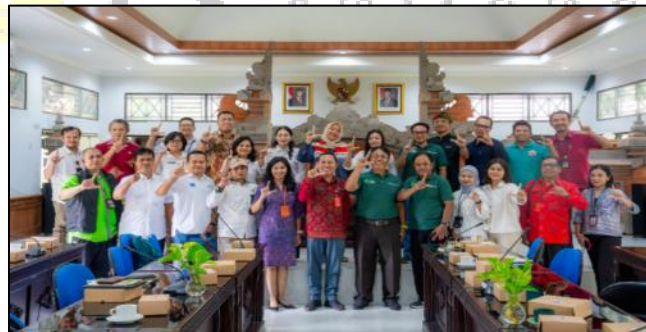
Gambar 3. Kegiatan Forum Group Discussion di DKLH Provinsi Bali pada Tanggal 22 Januari 2025

Berdasarkan Gambar 2. dapat dilihat bahwa melalui diskusi langsung di lapangan, para stakeholder dapat membedah perencanaan secara riil, mengidentifikasi tantangan fisik di area konservasi, serta merumuskan solusi yang tepat untuk pengembangan infrastruktur Alas Kedaton Monkey Forest . Secara konseptual, interaksi lapangan yang berkelanjutan ini bertindak sebagai media pembentukan shared understanding pada tingkat teknis. Proses peninjauan langsung ini mampu memperkuat komitmen dan sinergi antara pihak pengelola adat dengan pihak korporasi, sehingga program-program Corporate Social Responsibility (CSR) yang dijalankan dapat berjalan lebih optimal, tepat saran, dan berkelanjutan. Hubungan koordinasi ini tidak hanya berhenti pada level taktis-operasional di lapangan, melainkan juga dibawa ke tingkat strategis melalui forum-forum diskusi formal di tingkat provinsi, seperti yang digambarkan di bawah ini: