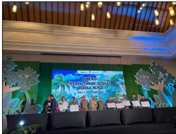
Gambar 4. Penandatanganan MoU

Secara analitis konseptual, temuan ini menunjukkan bahwa dalam kolaborasi makro, kepercayaan yang bersifat personal relasional harus bertransformasi menjadi kepercayaan yang terinstitusionalisasi. Manifestasi dari kepercayaan yang kuat antara Pengelola Alas Kedaton, Desa Adat Kukuh, Pemerintah Desa Kukuh, dan mitra formal dipertegas melalui ikatan hukum tertulis tersebut, sebagaimana terdokumentasi pada kegiatan berikut: