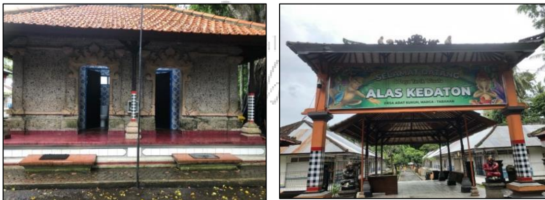
Gambar 5. Pembaharuan Fasilitas di Objek Wisata Alas Kedaton Monkey Forest

Manifestasi komitmen fisik melalui revitalisasi fasilitas bentuk komitmen nyata dari pihak pengelola dan mitra korporasi dalam menjaga keberlanjutan kolaborasi ini tidak sekadar berhenti pada retorika di meja sirkulasi rapat, melainkan teraktualisasi secara material pada aspek perbaikan sarana penunjang pariwisata di tingkat tapak. Perwujudan fisik dari komitmen transaksional tersebut disajikan pada visualisasi berikut: