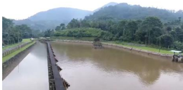
Gambar 4. Situs Batu Eon