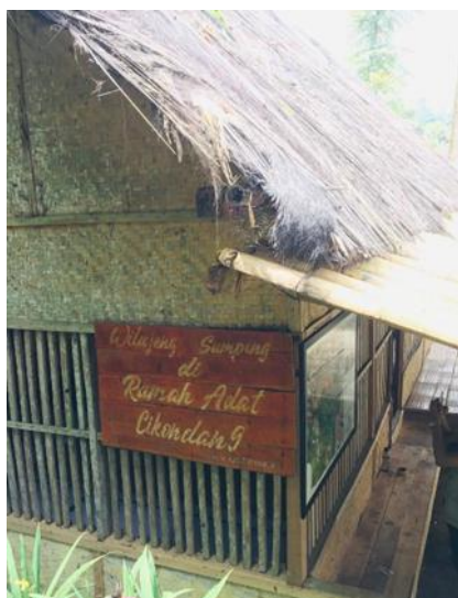
Gambar 5. Rumah Adat Cikondang

Rumah Adat Cikondang merupakan sebuah rumah dengan bangunan sederhana yang terbuat dari bambu, kayu, dan ijuk. Rumah Adat Cikondang difungsikan sebagai tempat pelaksanaan kegiatan adat masyarakat Desa Lamajang dan tempat menyimpan peralatan kegiatan adat tersebut. Rumah Adat Cikondang juga digunakan sebagai tempat pertemuan masyarakat dan tempat penyambutan wisatawan.