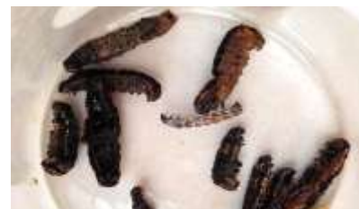
Gambar 2 Ulat Grayak yang Mengalami Mortalitas

Pada saat pengamatan terlihat semakin tinggi konsentrasi maka daun yang dimakan oleh ulat grayak juga semakin sedikit. Pada perlakuan P0 (kontrol) ulat grayak makan seperti biasa dan tidak mengalami gangguan. Pada perlakuan P1 dan P2 pakan banyak yang berlubang bahkan sobek, sedangkan perlakuan P3, P4, dan P5 terdapat sedikit lubang pada pakan. Beberapa jam setelah diberi perlakuan, ulat grayak mengalami perubahan perilaku sebagai gejala awal dari kematian diantaranya ulat grayak terlihat lemas tidak aktif bergerak, tidak terlihat aktivitas makan dan keluar cairan berwarna kuning kehijauan dari mulut ketika bagian perutnya disentuh. Selain itu, terjadi juga perubahan pada morfologi ulat grayak, warna tubuh ulat grayak yang semula berwarna hijau dengan bintik hitam berubah menjadi cokelat gelap kemudian lama-lama menghitam, tubuh mengerut dan kaku yang menandakan bahwa ulat grayak sudah mati. Ulat grayak yang mati ditunjukkan pada gambar di bawah ini: