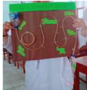
Gambar 1. Media Analog Proses Pembentukan Urine

Kemampuan penalaran ilmiah siswa pada aspek advance masuk pada kategori sedang. Pada aspek ini siswa diajak untuk mengevaluasi media analog yang dibuat dengan proses pembentukan urin dan kelainannya. Misalnya, siswa harus mengetahui fungsi gromerulus sebagai filtrasi sehingga zat atau molekul yang berukuran kecil dapat masuk ke dalam kapsul bowman. Kerusakan pada glomerulus dapat mengakibatkan kencing darah atau terdapat protein dalam urin (albuminuria) (Hawes, 1991). Siswa menganalogikan gromelurus sebagai botol air mineral pada gambar 1, sedangkan tubulus nephron dianalogikan dengan selang. Kemampuan penalaran siswa pada aspek ini masih terbilang sedang karena siswa juga belum dapat membuktikan peristiwa reabsorpsi yang melibatkan pembuluh darah sehingga mereka belum bisa membuktikan secara empiris.